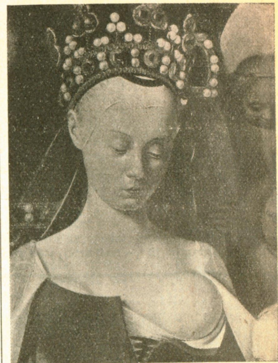
Foucquet: Madonna (part.)

Primitivi catalani Luis Morales (1509+1586) Sanchez Coello (1515+1590) El Greco (1548+1625) Francisco Pacheco (1571+1654) Francisco Herrera (1576+1656) José De Ribera (1588+1656) Franc. De Zurbaran (1598+1662) Diego Velasquez (1599+1660) Bortol. E. Murillo (1618+1682) William Hogart (1697+1764) Joshua Reynolds (1723+1792) Th. Gainsborough (1727+1788) George Romney (1734+1802) Henry Raeburn (1756+1823) William Blake (1757+1827) George Morland (1760+1804) Thomas Lawrence (1769+1830) Joseph W. Turner (1775+1851) John Constable (1776+1827) Francisco Goya (1746+1828) Singleton Copley (1738+1815) Gilbert Stuart (1755+1828)