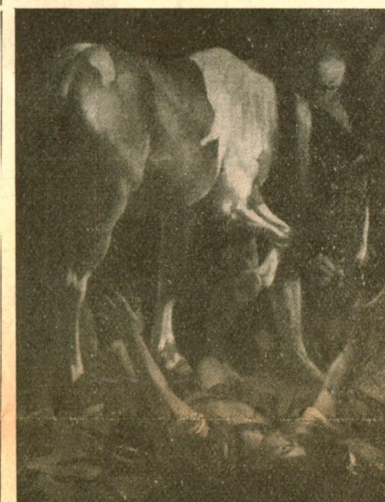
Caravaggio: Caduta di S. Paolo