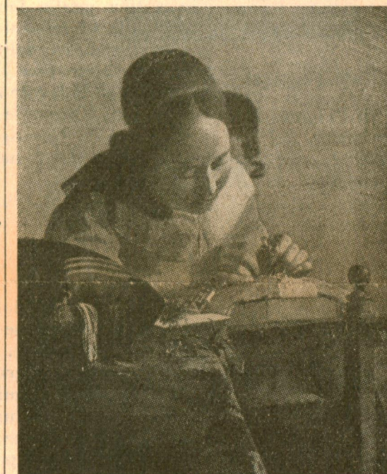
Vermeer: La Merlettaia (c. 1664)

Stefano da Zevio (c. 1375+1451) Pisanello (oper. 1425-1450)