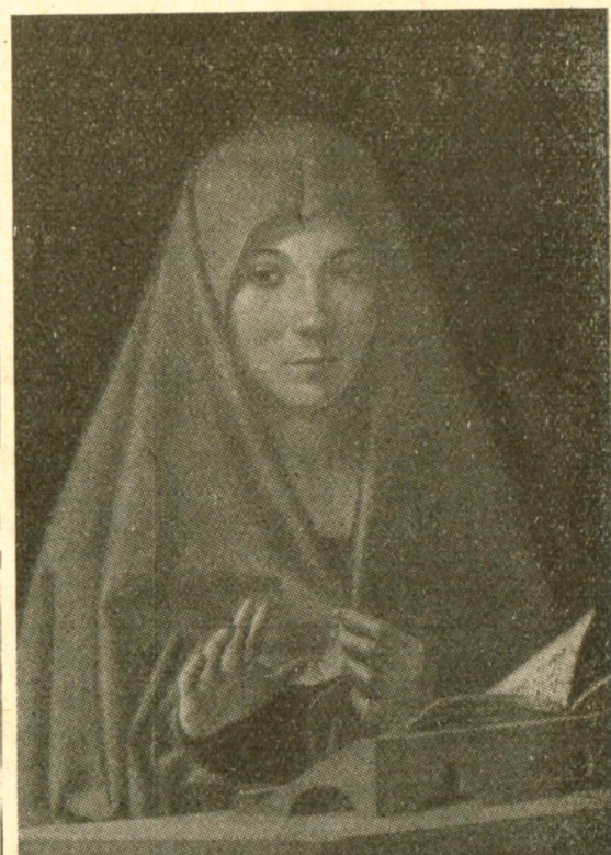
Antonello da Messina: Annunciata