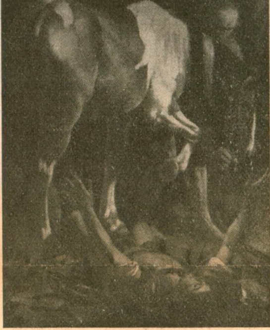
Caravaggio: Caduta di S. Paolo

Gius. Maria Crespi (1665+1747) Alessandr. Magnasco (1667+1749)