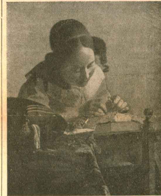
Vermeer: La Merlettaia (c. 1664)

(1596+1656) Aelbert Cuyp (1620+1691) Jan Cappelle (c. 1624+1679) J. Van Ruysdael (1628+1682) W. Van de Velde il G. (1633+1707) Meindert Hobbema (1638+1709)